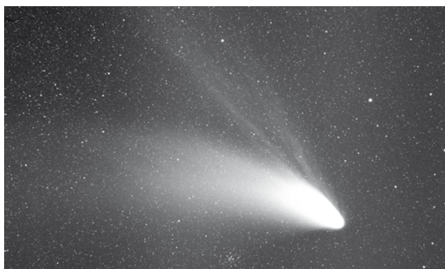
Komet Hale-Bopp 2009

Gott verlassenheit macht sich breit bei den Gefangenen in Babylon, verwirrt die Gedanken und kriecht in die Knochen: Volk Gottes sind wir gewesen, aber als es darauf ankam, hat er uns unseren und damit seinen Feinden tatenlos preisgegeben. Warum? Fragen, die alle Gewissheiten in Frage stellen und gar den Verdacht aufkommen lassen, es war alles ein großer Irrtum, bloßes Wunschdenken, und wir sind in Wahrheit allein und verlassen, im wahrsten Sinne hilflos ausgeliefert den Mächten dieser Welt.